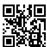
Ersatzhaltestelle Richtung Soltau